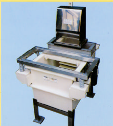
超振動ニュー \alpha -EH-4型